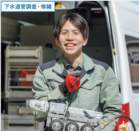
下水道管調査・修繕

幅広い仕事をしている金沢環境サービス公社の先輩たち。どんな仕事をしているの？どんな仲間がいるの？そんな疑問にお答えするために、先輩の本音を集めました。ここで働く魅力を、ぜひ感じ取ってください！