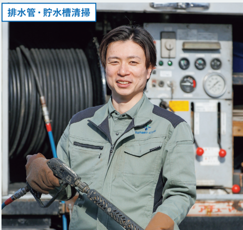
排水管・貯水槽清掃